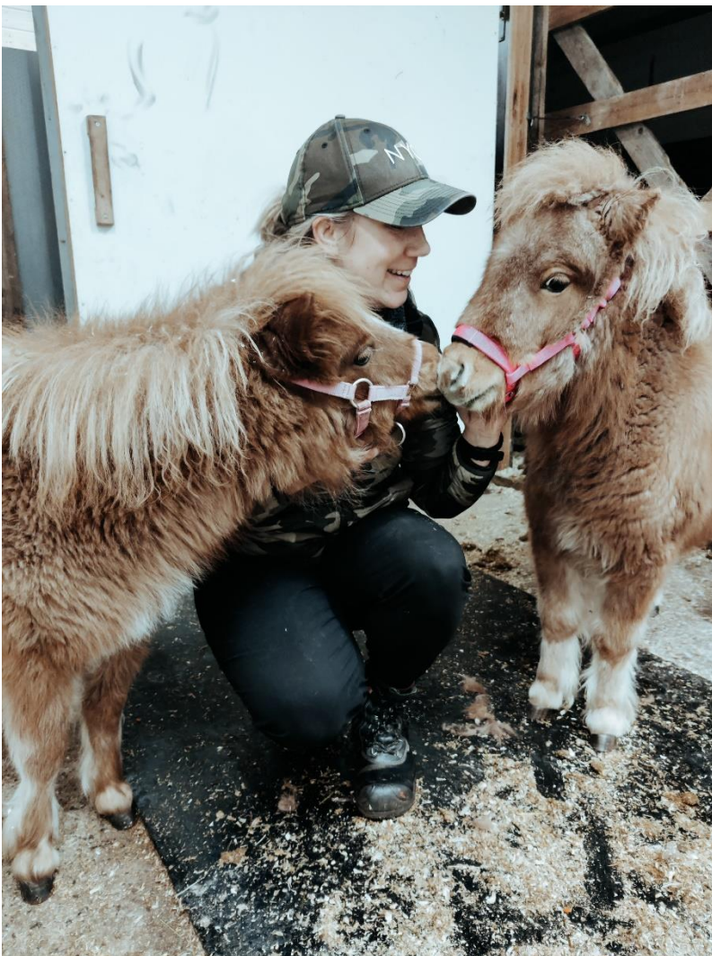
Ponivarsojen tunnistus.