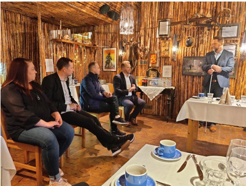
Työhyvinvointi-ilta sai paljon kiitosta.

Tilakäyntien yhteydessä neuvonta voidaan kohdistaa yksityiskohtaisesti vastaamaan ko. tilan neuvonnantarvetta. Hevostenpitäjien neuvonta sujuu luontevasti, luottamuksellisesti ja rakentavalla tavalla tilakäyntien yhteydessä ja mahdollisiin ongelmiin voidaan puuttua ajoissa. Eläinten hyvinvointiin voidaan vaikuttaa neuvonnan kautta ja näin ennaltaehkäistä varhaisella puuttumisella haasteellisten tilanteiden syntymistä. Liitto tarvitsee riittävät resurssit neuvontaan, koulutukseen ja muuhun yhteydenpitoon asiakkaiden kanssa. Vuonna 2021 järjestimme hevosihmisille työhyvinvointi-illan ja palaute tapahtumasta oli positiivista. Vastaavia tilaisuuksia toivottiin myös tulevaisuudessa.