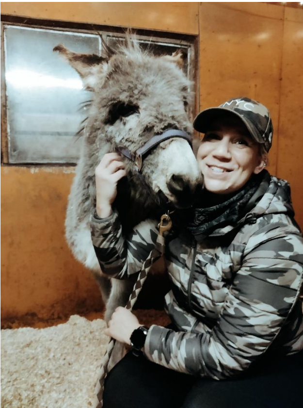
Aasin tunnistus.