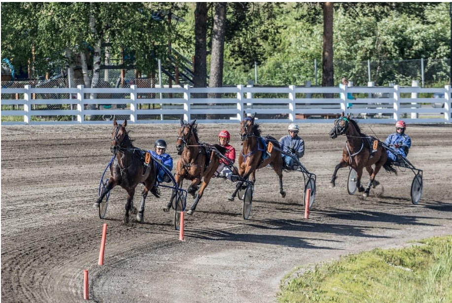
Hiittiravien järjestäminen on tärkeää toimintaa.

Oulussa ajettujen hiittiravien käytännön järjestelyistä liitto on vastannut yhteistyössä jäsenseurojen ja Oulun seudun ravinuorten kanssa. Harjoitus- ja paikallisravien käytännön järjestelyistä ovat vastanneet jäsenseurat. Ylivieska on vastannut hiittiravi toiminnastaan itsenäisesti. Oulun hiittiravien yhteydessä on hoidettu myös Hevosjalostusliiton neuvontaa ja asiakaspalvelutehtäviä.