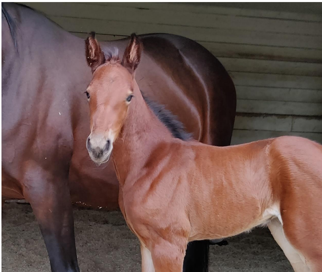
Varsoissa on tulevaisuus.