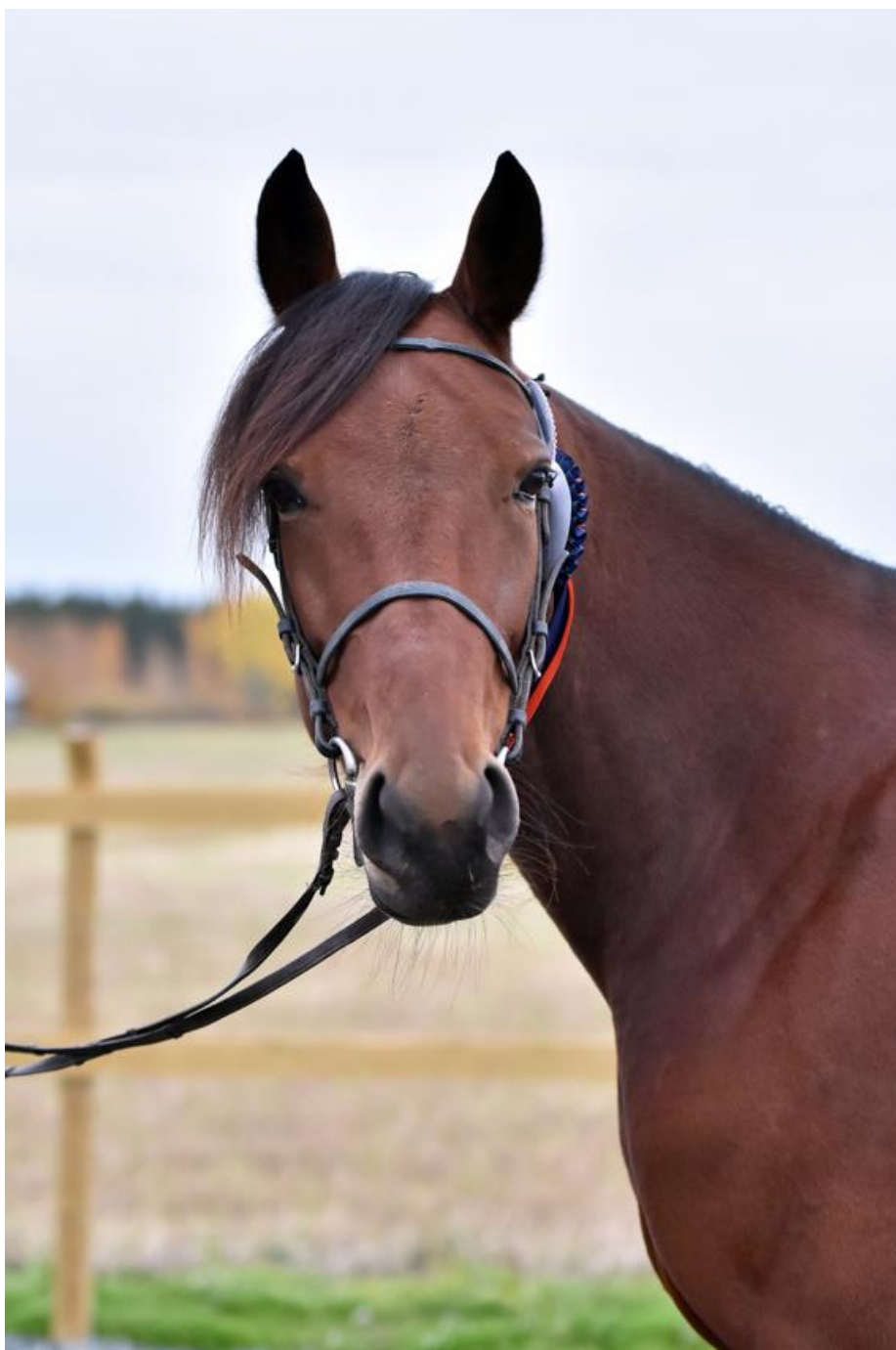
Allison April jalostusarvosteltiin Ylivieskassa.

Tammanäyttely pidettiin Oulussa 3.6.2021, tamma- ja varsanäyttely Ylivieskassa 30.9.2021 ja Ruukissa 14.10.2021. Näyttelytoiminnalla on hevoskasvatukselle ja omistajuudelle suuri merkitys. Puolueettoman rakennearvion lisäksi tilaisuudessa saavat kasvattajien lisäksi kokemusta myös varsat, jotka voivat olla näyttelypäivänä esimerkiksi ensimmäistä kertaa vieraassa paikassa. Näyttelytapahtuma on varsalle kasvattava ja paljon kokemuksia sisältävä päivä, joka valmistaa varsaa tuleviin koitoksiin kilpa- ja harrastehevosena.