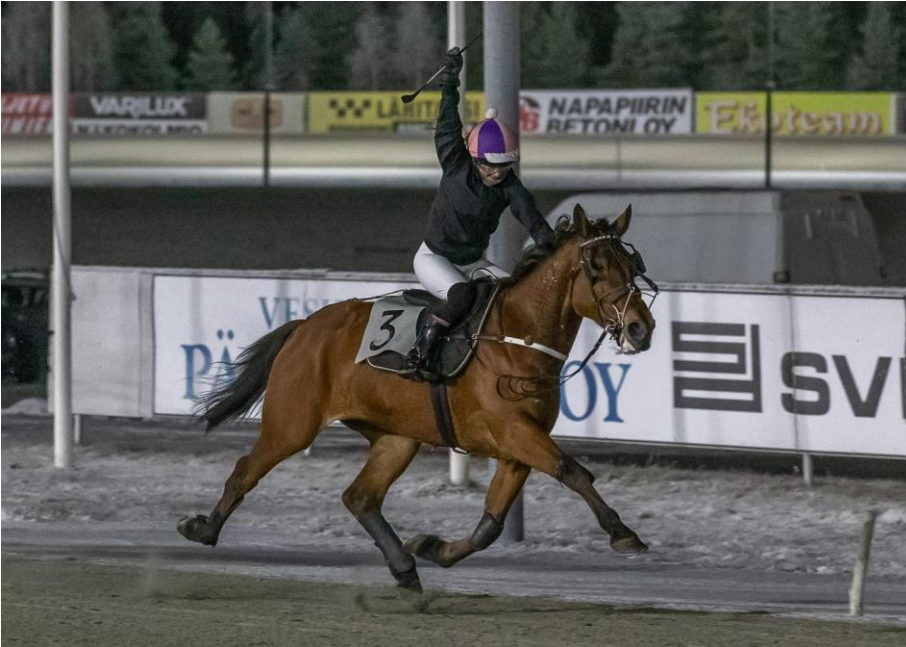
Hevosjalostusliitot kouluttavat uusia osaajia.