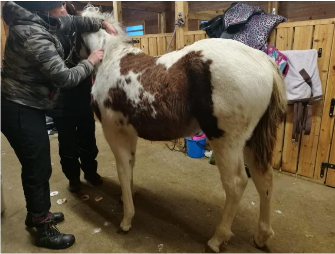
Quarter varsan tunnistus.