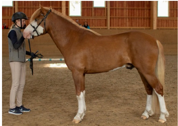
o. Rasantaja, paras pienhevosvarsa