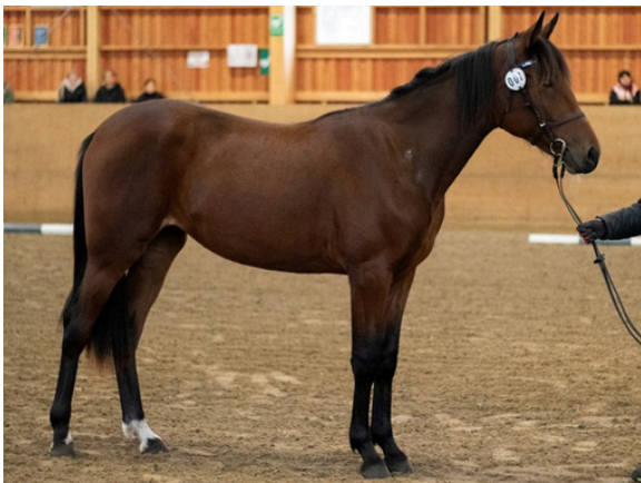
t. Fantasia De Lago, paras lämminverivarsa