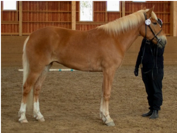
t. Super-Venus, paras juoksijavarsa